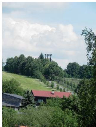
Výhled na krmelínský kopec od pana Menšíka.