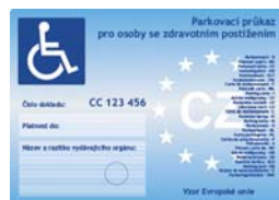
nová parkovací karta pro osobu těžce zdravotně postiženou