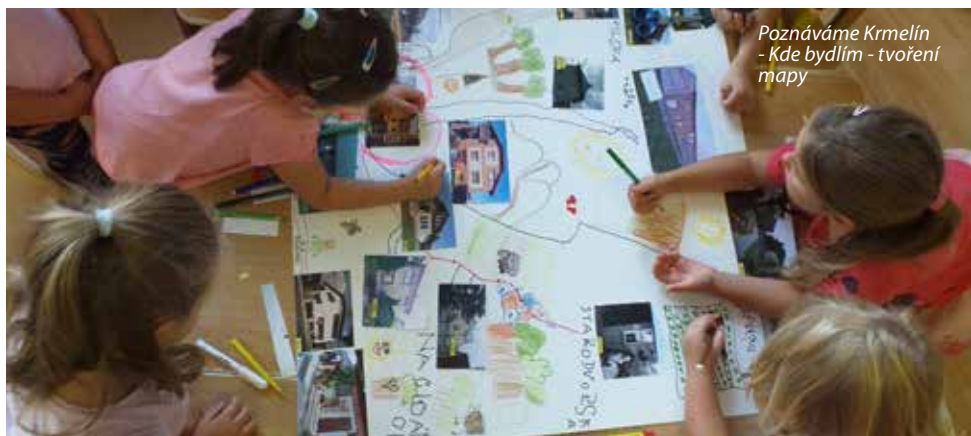
Poznáváme Krmelín - Kde bydlím - tvoření mapy