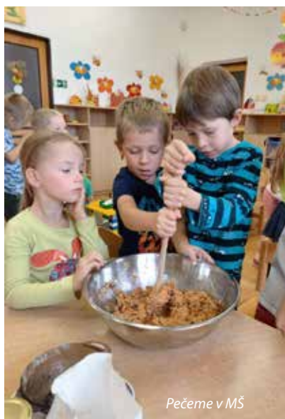
Pečeme v MŠ