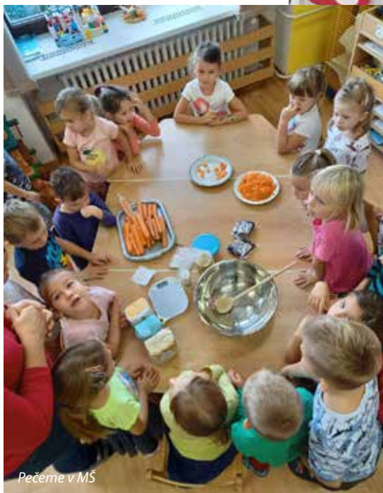
Pečeme v MŠ