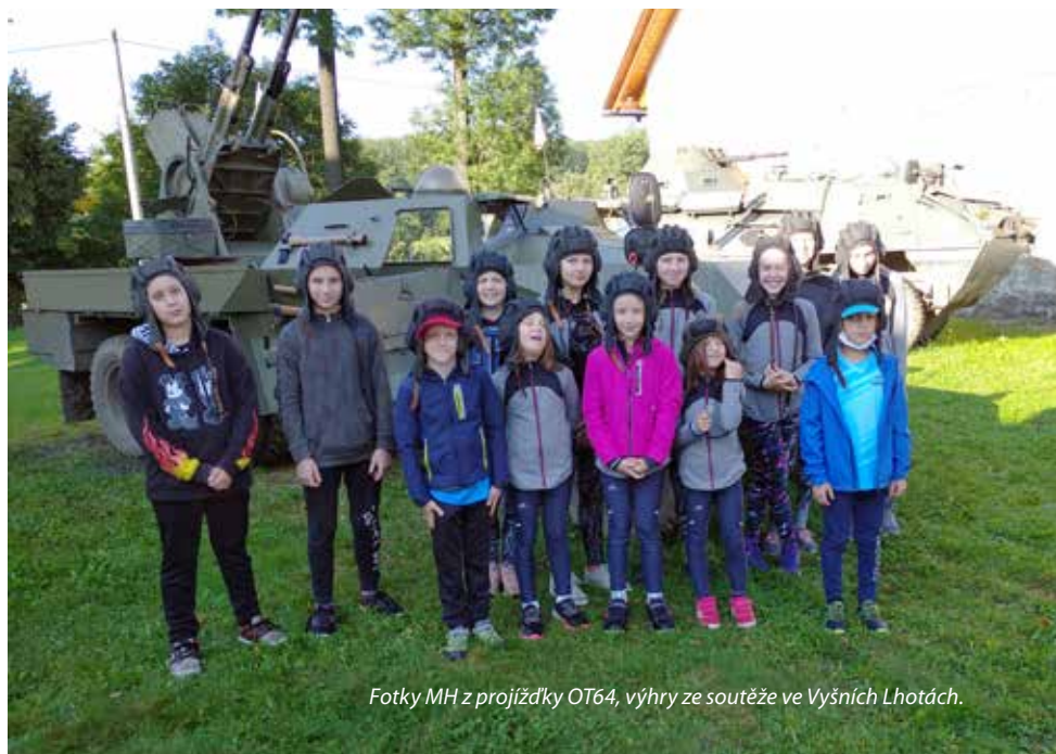
Fotky MH z projíždky OT64, výhry ze soutěže ve Vyšních Lhotách.