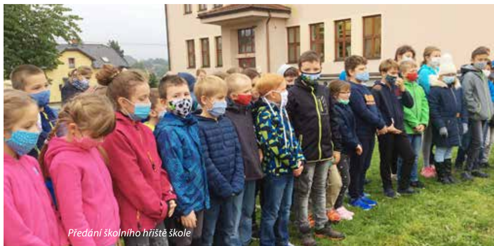
Předání školního hřiště škole