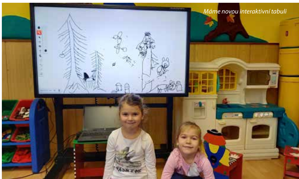
Máme novou interaktivní tabuli