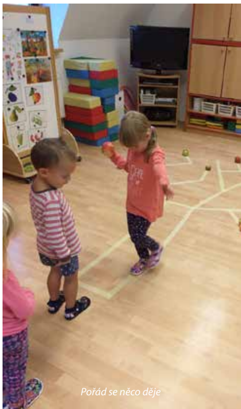
Pořád se něco děje