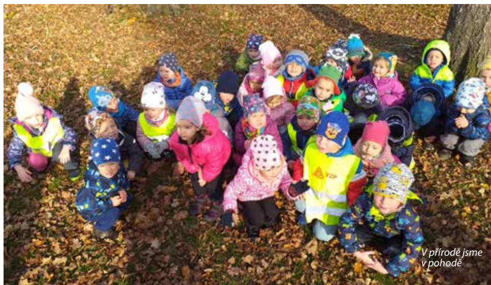
V přírodě jsme v pohodě