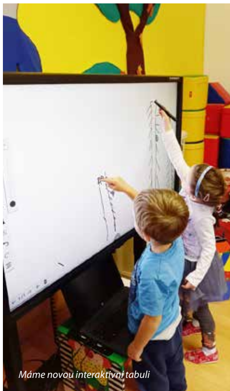
Máme novou interaktivní tabuli