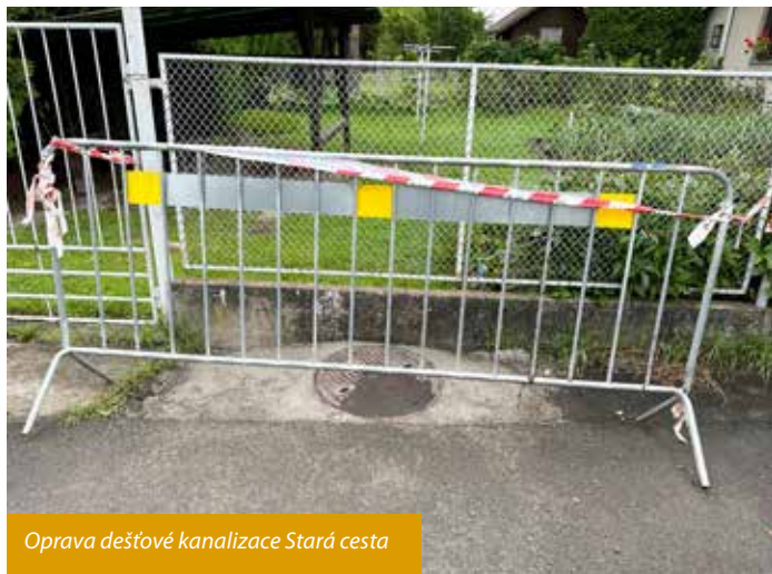
Oprava dešťové kanalizace Stará cesta

Chtěla bych vás informovat o dalších dvou problematických projektech, které by měly být realizovány v k. ú. Paskov, kde jsou podány 2 petice :