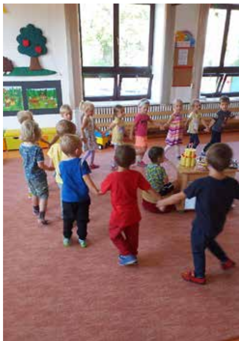
První dny u zelených