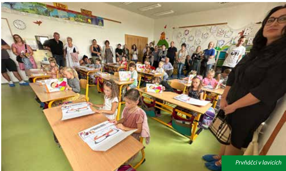
Prvníáci v lavicích