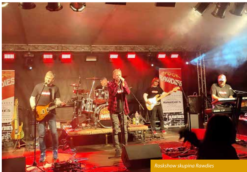
Rockshow skupina Rawdies