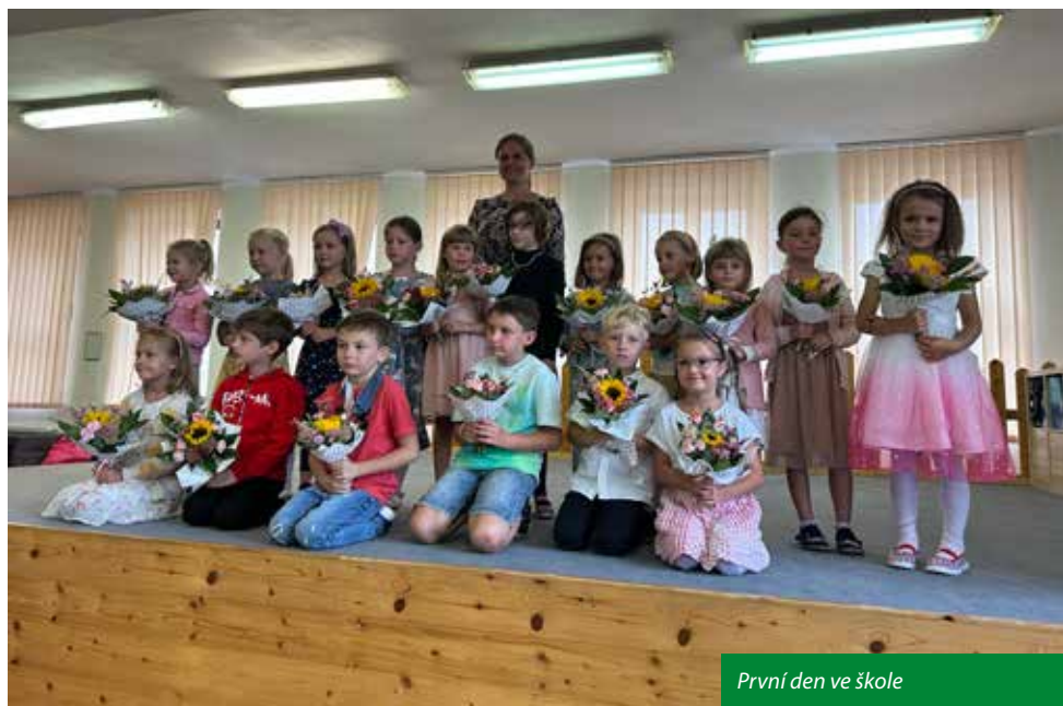
První den ve škole