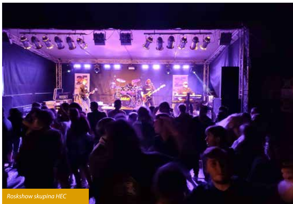
Rockshow skupina HEC