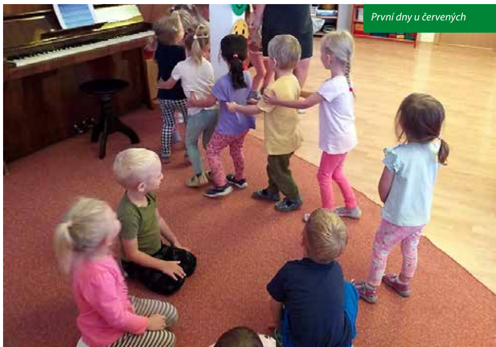
První dny u červených