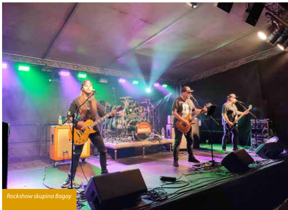
Rockshow skupina Bagoy