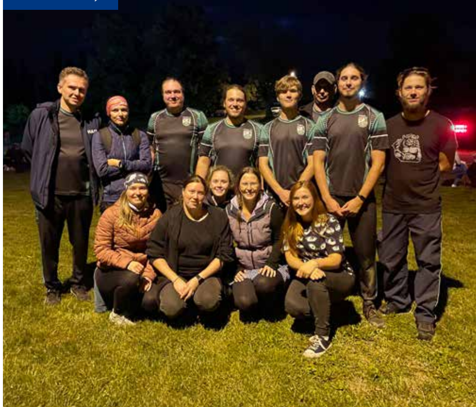
Družstva muži a ženy