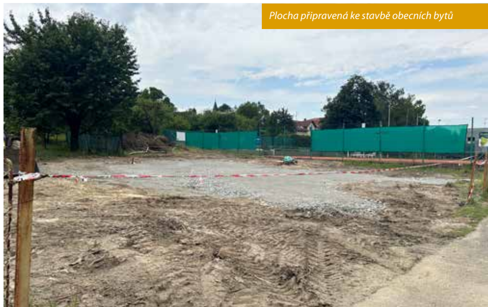
Plocha připravená ke stavbě obecních bytů

Upozorňuji, že od 1. září 2023 začala Obecní policie Hukvaldy vykonávat úko-