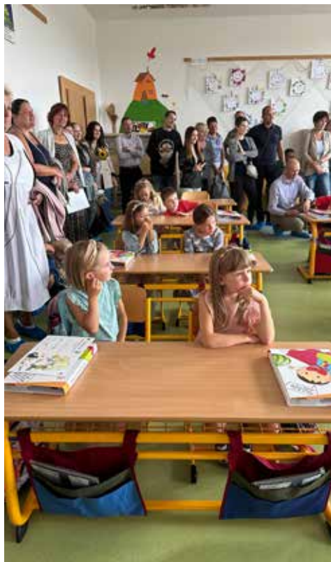
Poprvé v lavicích