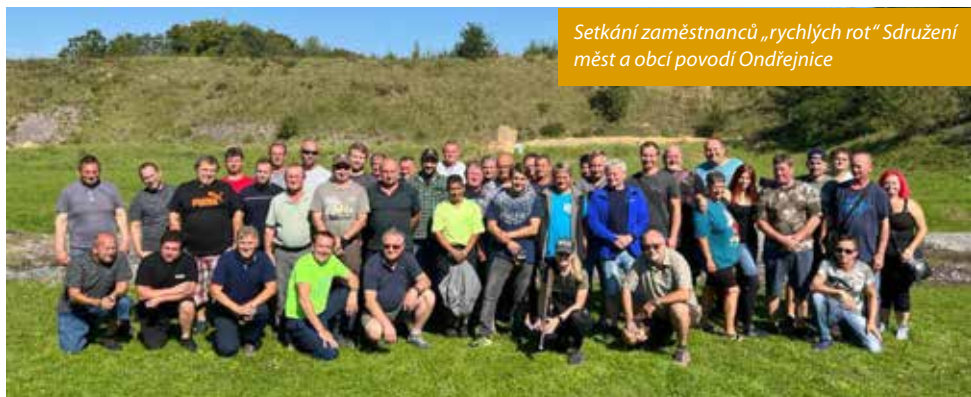
Setkání zaměstnanců „rychlých rot“ Sdružení měst a obcí povodí Ondřejnice

Na základě již zpracované studie jsme zažádali Moravskoslezský kraj o dotaci na projektovou dokumentaci chodníku a parkování kolem obecního úřadu, a byli jsme úspěšní, získali jsme dotaci 400 tisíc Kč. Proběhlo již poptávkové řízení na projektanta.