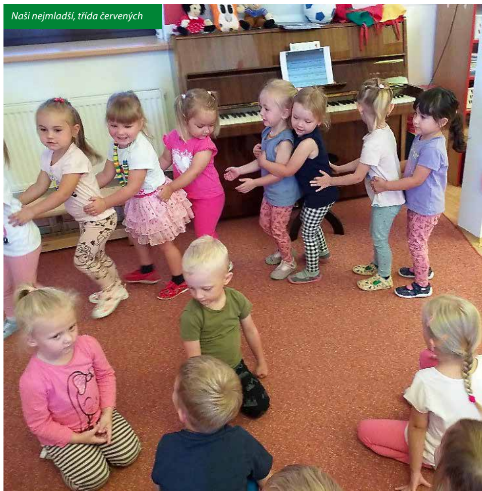
Naši nejmladší, třída červených