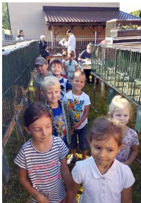
Návštěva u chovatelů na výstavě