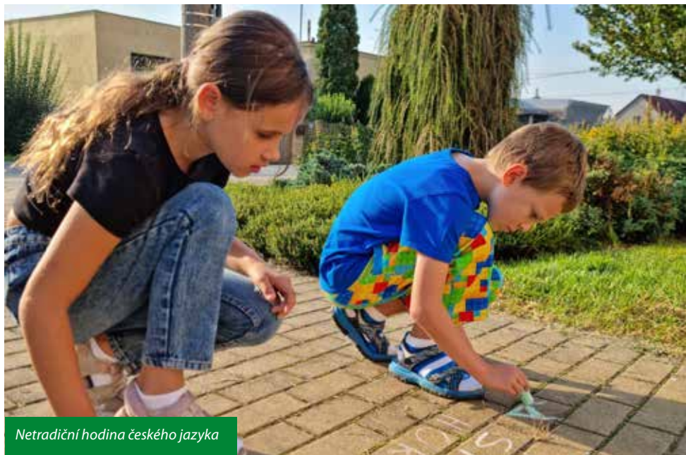
Netradiční hodina českého jazyka