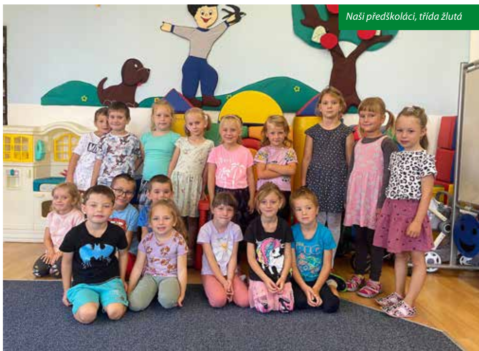
Naši předškoláci, třída žlutá