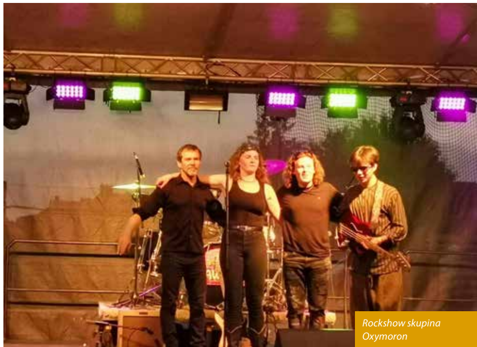
Rockshow skupina Oxymoron